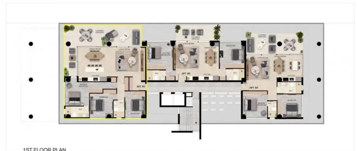
1ST FLOOR PLAN